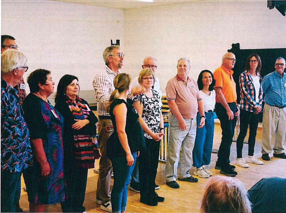
A gmüendi egyesület vezetősége a testvérvárosi egyesületek vezetőivel