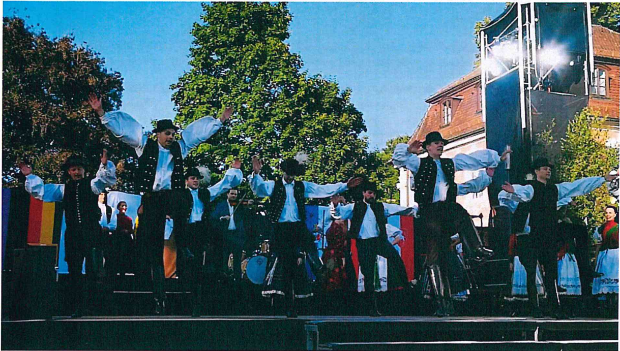
Az albás fiúk majdnem összedöntötték a színpadot a fergeteges táncukkal,...