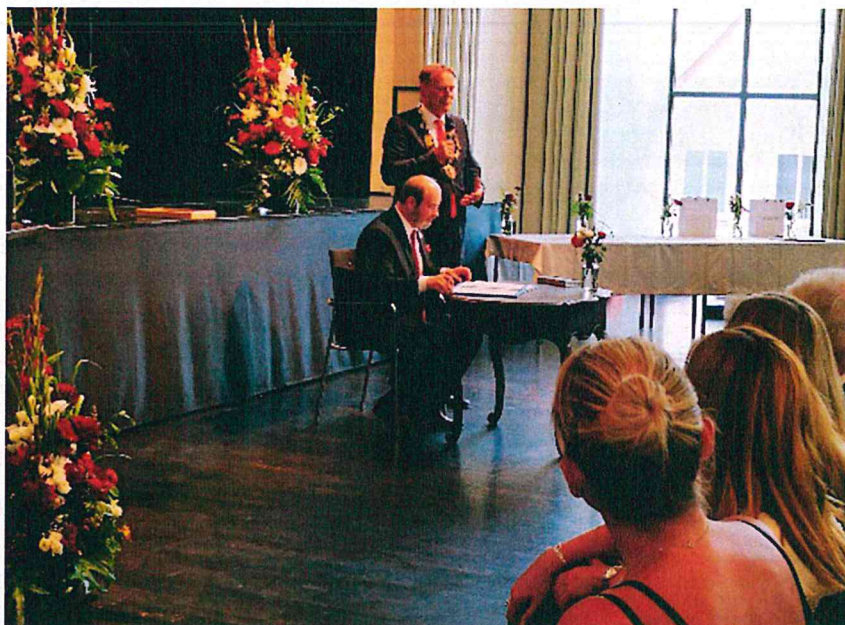
A kapcsolat hivatalos megerősítése