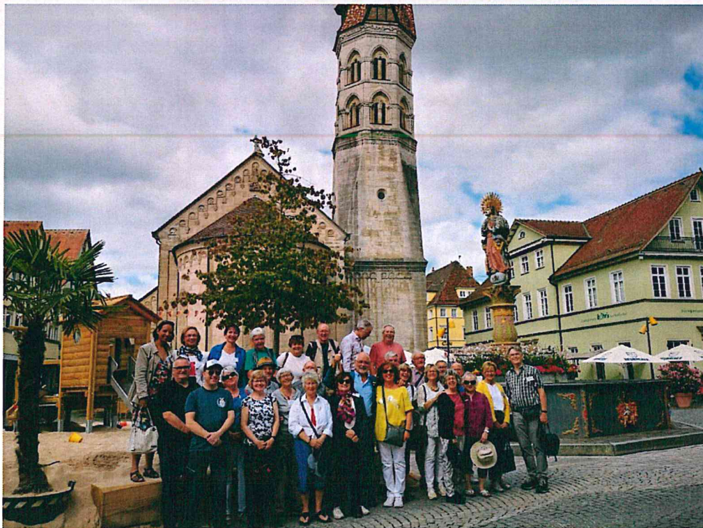
Vendéglátók és vendégeik a Marienbrunnen előtt