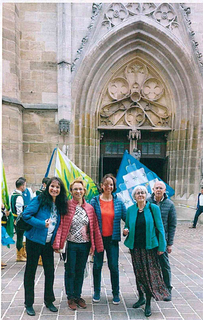
Az ünnepi ökumenikus istentisztelet után a Münster kapujában