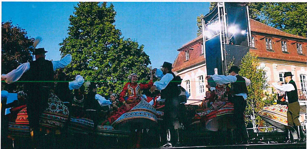
... de a lányok is felvették velük a versenyt