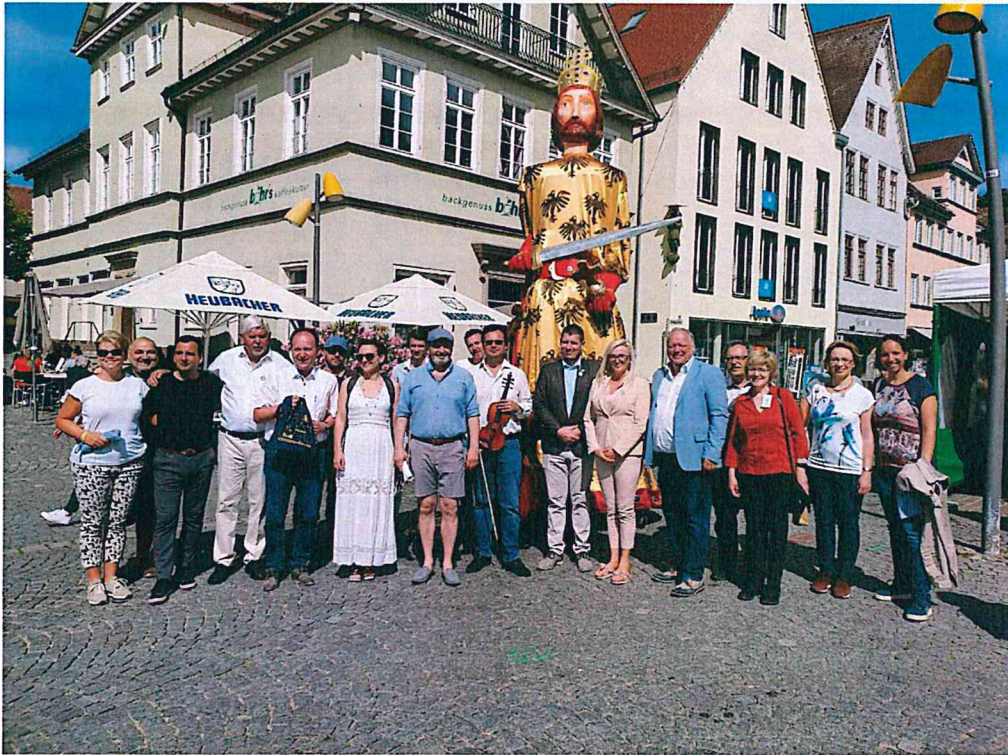
A magyar delegáció a Marktplatzen Barbarossa Frigyesel.