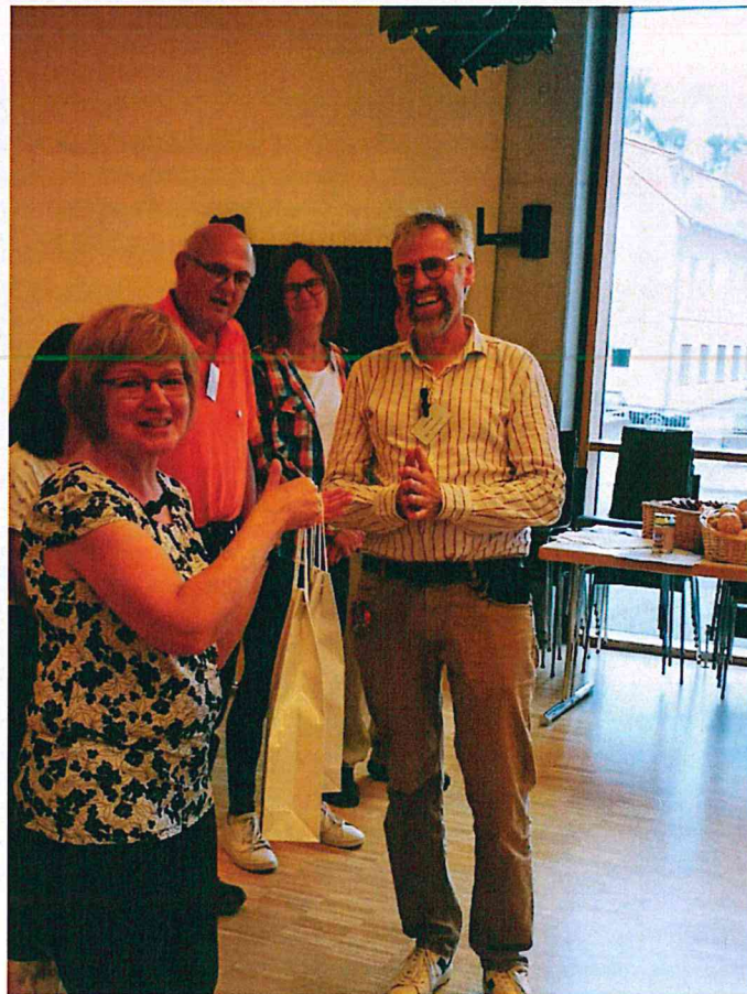
Egy kis Hungarikum a közös ünnepléshez