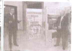
A kiállítás megnyitóján a városi önkormányzat képviselői és a Nemzeti Városok Csoportja tagjai.