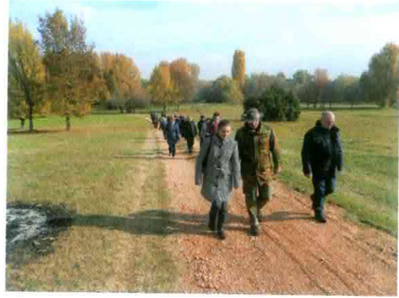
2016.11.23-30 , Opole