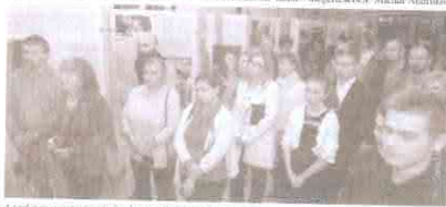
A kiállítás megnyitóján a városi önkormányzat képviselői és a Nemzeti Városok Csoportja tagjai.

A Nemzeti Városok Csoportja és az Újfehérvári Községi Önkormányzat közös kezdeményezésére a 1956-os forradalom 60. évfordulójára emlékeztető kiállításra kerül sor a városban október 20-án.