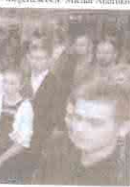
A kiállítás megnyitóján a városi önkormányzat képviselői és a Nemzeti Városok Csoportja tagjai.